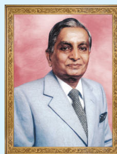
Sri Madhav Prasadji Birla (1918 - 1990)

This Scholarship Scheme will award around 25 successful aspirants a sum of ₹ 24,000/- each per year towards meeting their expenses in the form of tuition fees, boarding and mess charges and on study materials and shall remain valid for the entire duration of their course, but not exceeding 4 (four) years. At its full strength, the Trust will disburse ₹ 24,000/- to 100 aspirants each year, i.e. 25 each in the First, Second, Third and Fourth year of their respective courses, wherever applicable. The final decision on distribution of scholarships shall be reserved with the Madhav Prasad Priyamvada Birla Apex Charitable Trust which can, at any point of time, change the number of recipients and/or the amount of Scholarships or discontinue the Scholarship Scheme without assigning any reasons.